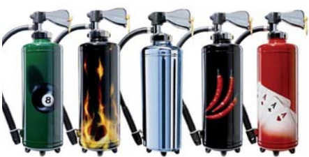
Angetreten: Designfeuerlöscher.

Schicke Feuerwehr Ein Feuerlöscher sollte in jedem Haushalt vorhanden sein. Ist er aber leider nicht. Das mag daran liegen, dass man nie so recht weiss, wohin mit dem Ding – schliesslich sind Feuerlöscher keine optische Offenbarung. In vielen Fällen landet er im Keller oder in der Garage, was im noch so kleinen Brandfall kritisch werden kann. Steht der Feuerlöscher aber griffbereit, können Studien zufolge 80 Prozent aller Brände im Keim erstickt werden. Die Design-Feuerlöscher der Firma Minimax haben derart schicke Outfits, dass es doch schade wäre, sie an unsichtbarer Stelle zu deponieren. sh