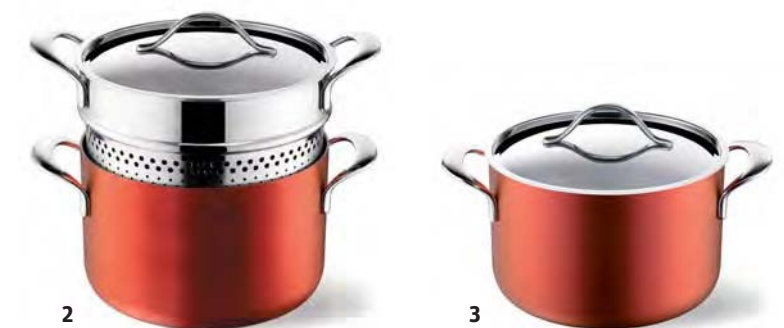
Foto gross) Mit «Swissculinaria» kommen die Vorzüge von Glas in die Küche – als Arbeitsplatten und Rückwände, Fronten und Regalflächen, Abdeckungen und Designelemente. Glas Trösch 1) In Zusammenarbeit mit dem renommierten Produktdesign-Team «StauffacherBenz» aus Uster schuf Elbau eine Küche, in der warme Materialien und Farben mit der kühlen Eleganz des Sichtbetons eine harmonische Verbindung eingehen. Elbau 2+3) Mit Pfannen von Lagostina wird Kochen als Kunst zelebriert. Lagostina