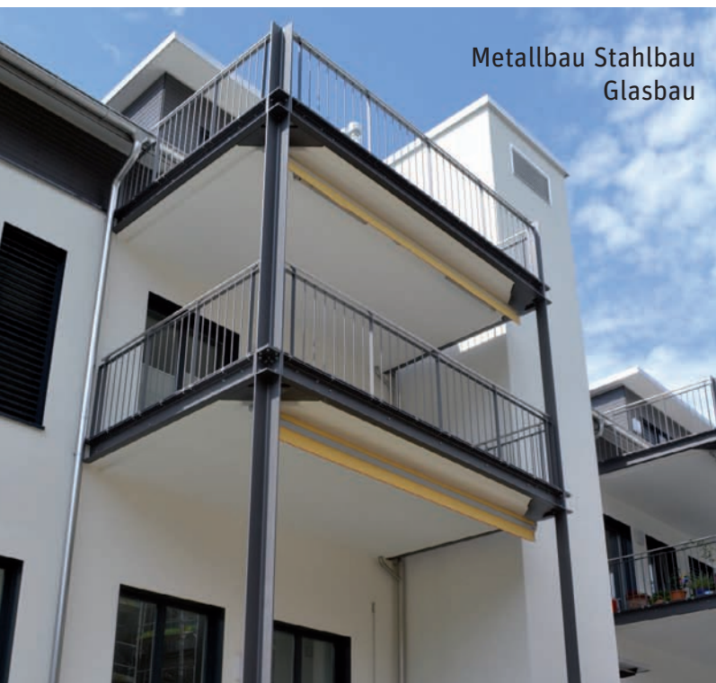
Metallbau Stahlbau Glasbau