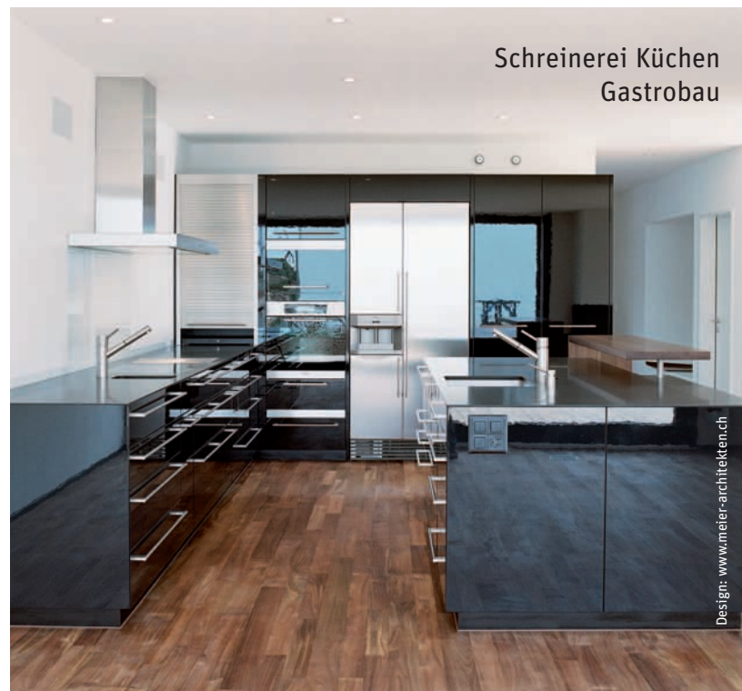
Schreinerei Küchen Gastrobau